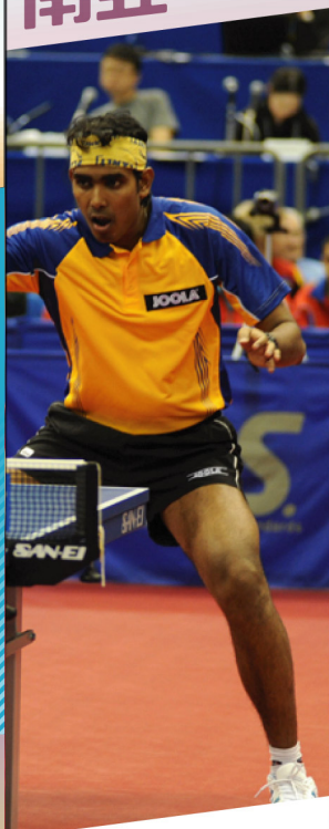
ACHANTA Sharath Kamal 阿昌特