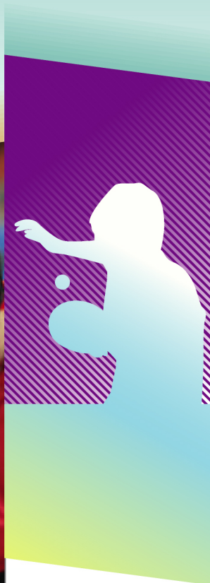
KIM Song Nam 金成南