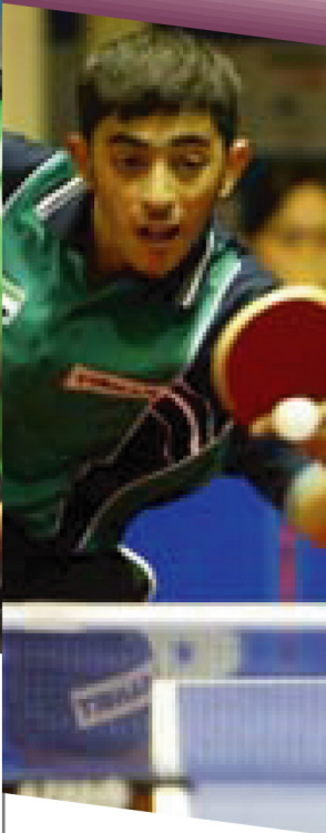
HASSAN Rashed 哈生

Country / Region 國家 / 地區: U.A.E. Emirates 阿聯酋