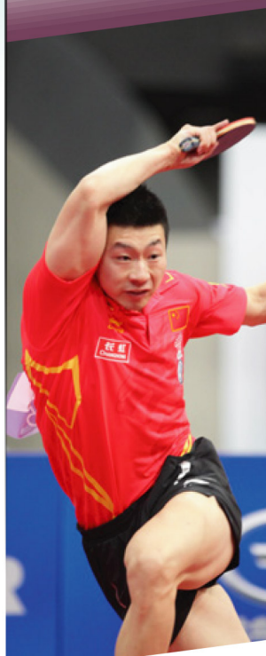
MA Long 馬龍