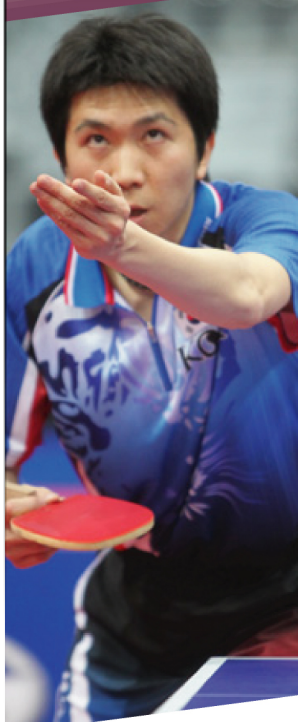
RYU Seung Min 柳承敏