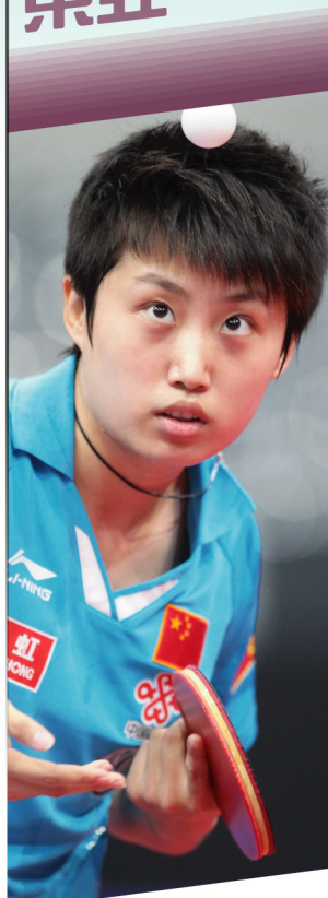
GUO Yue 郭躍